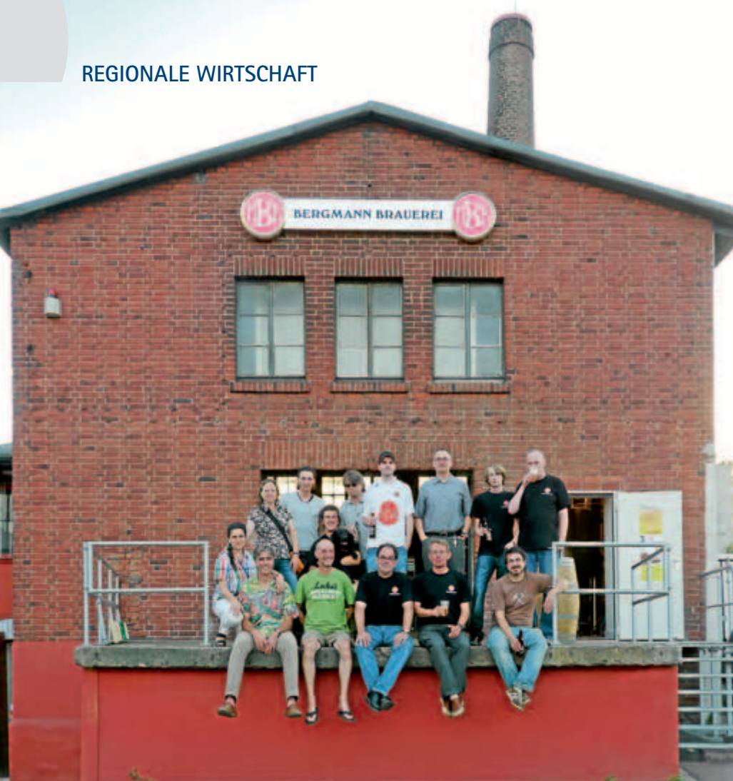
Das Team der Bergmann Brauerei