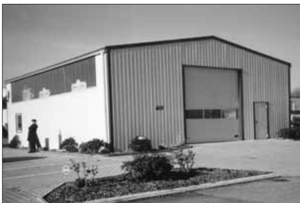
Halle wie abgebildet: Breite 12,50 m x Länge 20,00 m x 4,50 m Traufe

ab Werk: € 30.890 zzgl. 19% MwSt. zuzüglich Montage, Anfahrt- und Transportkosten