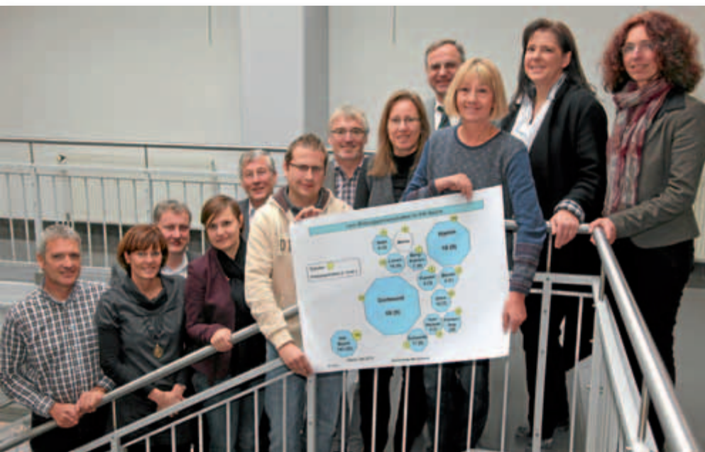
Teilnehmer der Tagung für Koordinatoren von Schulpartnerschaften aus dem IHK-Bezirk.

Die Koordinatoren suchen immer wieder interessierte Betriebe aus Industrie, Handel und Handwerk, die sich der