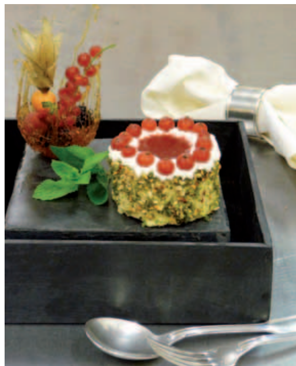
Das Auge isst mit!

Kulinarische Liebhaber kommen ab sofort wieder auf ihre Kosten. Es ist ein neues Restaurant Bonus-Buch für Dortmund und den Kreis Unna erschienen. In dieser Ausgabe stellen sich 52 Gaststätten der gutbürgerlichen und internationalen Küche vor. Mit dabei sind beispielsweise das „Landgasthaus Schulenhof“ in Dortmund, der „Stiftskeller“ in Fröndenberg, das „Palazzo“ in Holzwickede und das Restaurant „Oller Kotten“ in Unna. Die gastronomische Vielfalt der ausgewählten Betriebe können die Gäste zu zweit erleben. Unter dem Motto „zweimal Genießen – einmal Zahlen“ ist die Begleitperson des Besuchers zu einem Gratis-Essen eingeladen. Das Buch ist im Buchhandel erhältlich und kostet 15,90.