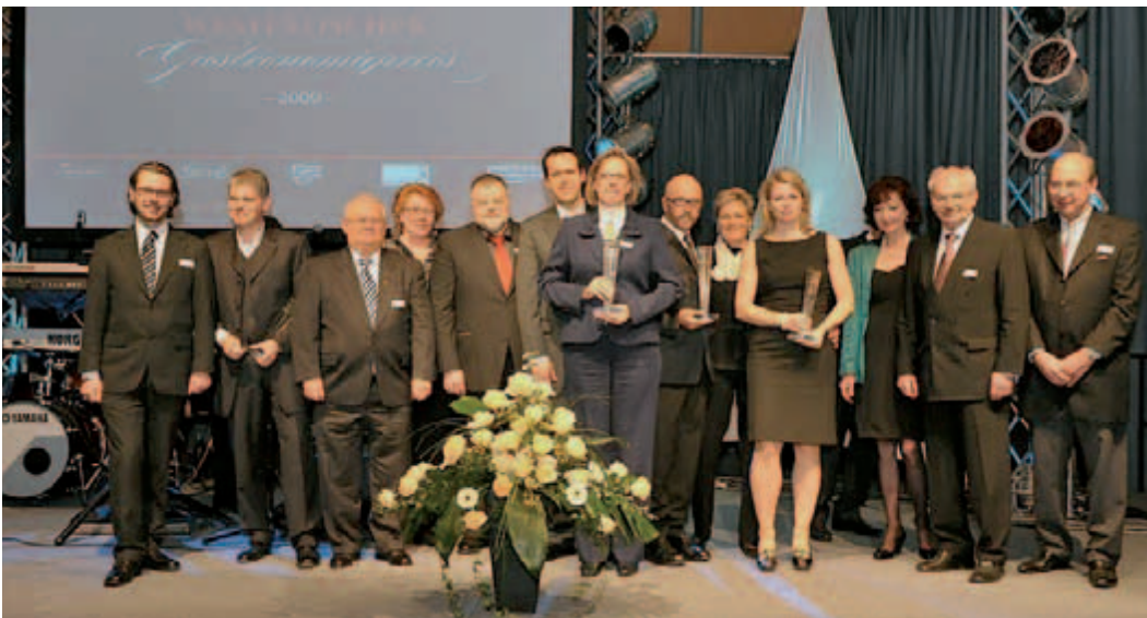
Die Preisträger des Westfälischen Gastronomiepreises 2009.