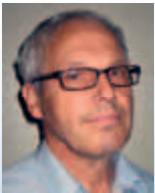
Klaus Fischer Fischer Transport GmbH Spenglerstr. 14 b 59067 Hamm

Wahlgruppe 7: Verkehrs-, Informations-, Kommunikationsgewerbe, Medien • 1 Sitz