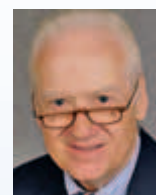
Gerhard Rüschenbeck Juwelier Rüschenbeck KG Westenhellweg 45 44137 Dortmund