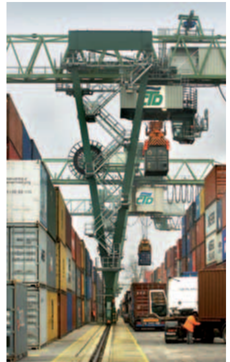
Das Container Terminal Dortmund konnte im 1. Halbjahr 2009 steigende Stückzahlen verzeichnen.

Mit 289.200 Tonnen liegt der Mineralölumschlag auf Rang 2 der Statistik. Hier