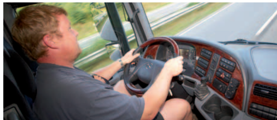
Berufskraftfahrer sollten ihre Fortbildung nicht auf die lange Bank schieben.

„Berufseinsteiger im Bereich Güterverkehr, die ab dem 10.09.2009 ihre Fah-