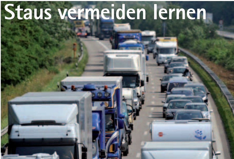
Staus beeinträchtigen nicht nur Reisende, sondern auch den Güterfernverkehr. Um dies zu vermeiden, gibt es einen neuen Studiengang Verkehrsinformatik in Erfurt.