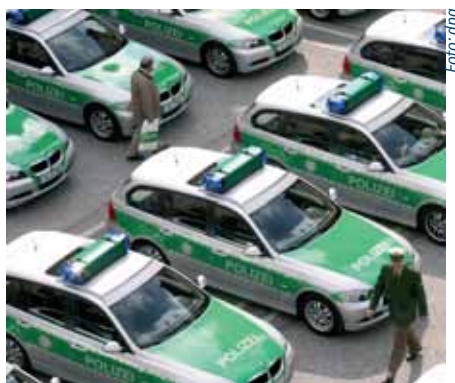
Neben Kommunen und der Polizei halten vor allem Unternehmen große Fuhrparks vor.

Trotzdem präsentiert sich der deutsche Flottenmarkt auch in dem gegenwärtig schwierigen Umfeld nach Angaben des Marktforschungsinstituts Dataforce robust. Der Anteil der gewerblich genutzten Pkw an allen Neuzulassungen des Jahres hat sich 2008 bei knapp 60 Prozent stabilisiert – eine solide Basis, um mit Realismus in die Zukunft zu schauen. Nach vorne schauen auch die Herausgeber des „Ratgebers Dienstwagenmanagement 2009“. VR Leasing, Deloitte, Dataforce und das F.A.Z.-Institut stellen das handliche Nachschlagewerk zum sechsten Mal vor – wieder komplett überarbeitet, wieder mit neuen Themen. Einen Schwerpunkt bildet das Qualifikationsprofil von Fuhrparkmanagern. Die Anforderungen an sie sind in den vergangenen Jahren immer weiter gestiegen.