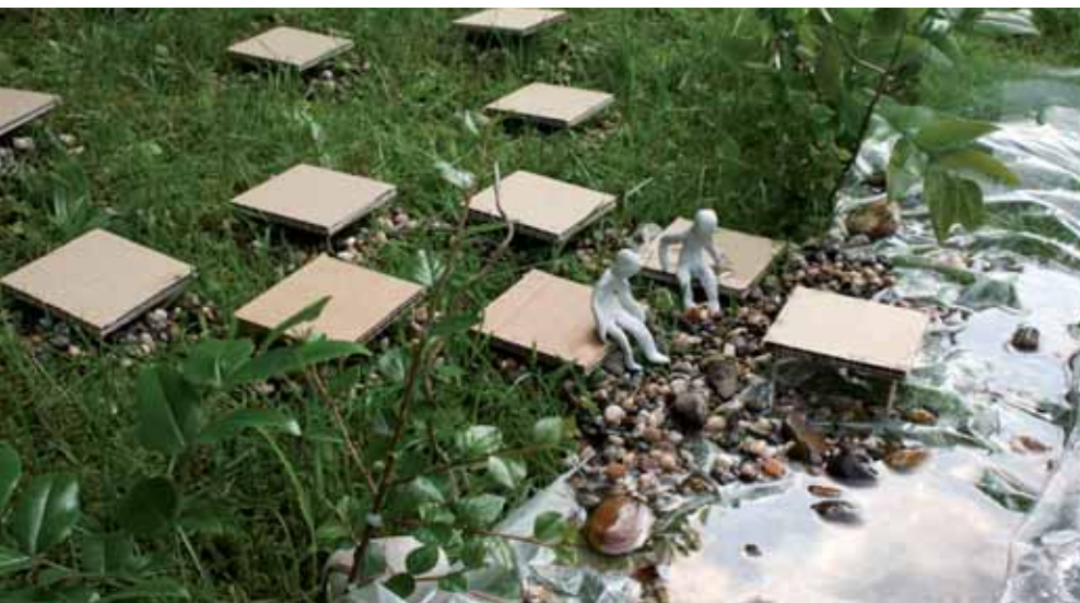
„Stufen zur Körne Dortmund“ heißt diese Installation der Künstlerin Danuta Karsten, die im Rahmen des Kulturhauptstadtprojektes „Über Wasser gehen“ als temporäres Kunstwerk realisiert wird.