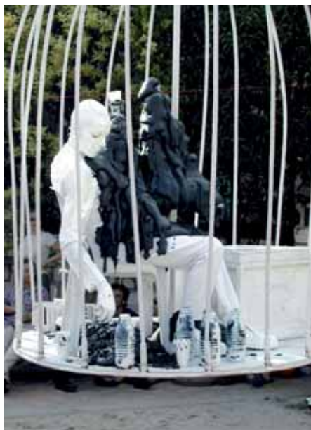
„Mousse au Cage/Schaum im Käfig“ heißt die Inszenierung der französischen Compagnie Ilotopie. Um ca. 22:30 Uhr auf dem kleinen Marktplatz in Schwerte.

Zu den Höhepunkten zählt die „Odyssee“ der Gruppe Titanick (Münster/Leipzig), die die Geschichte des antiken Helden