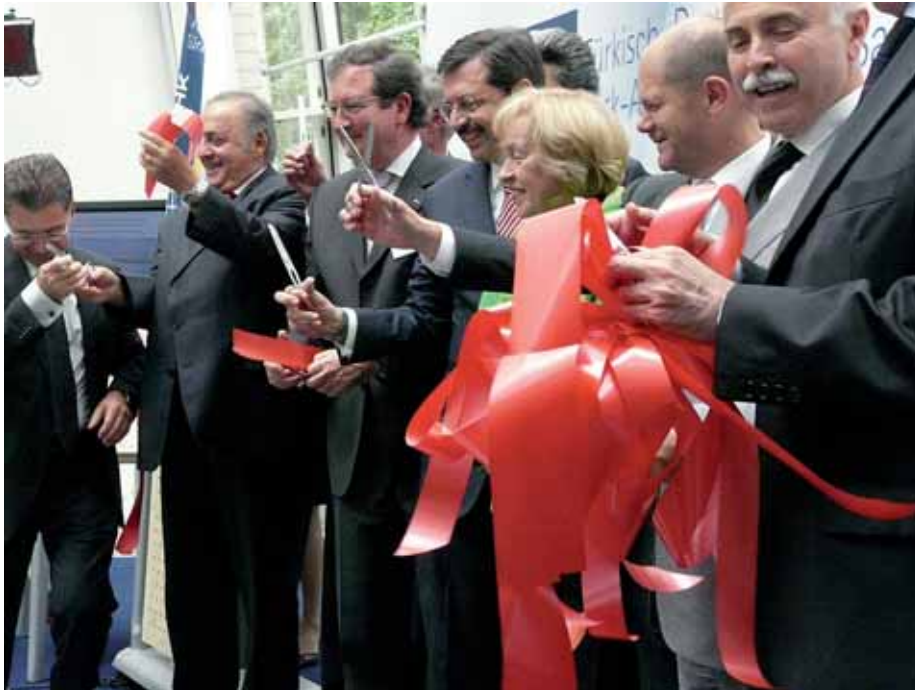
Symbolisches Zerschneiden des Eröffnungs-Bandes in Berlin.