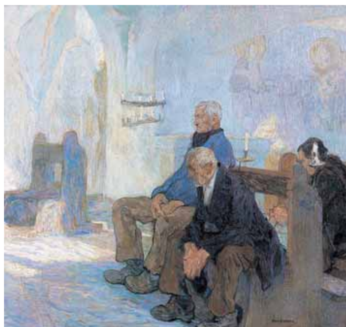
„Die Moselbauern“ von 1911.

Schloss Cappenberg, 59379 Selm-Cappenberg, Tel.: 02306 71170, Öffnungszeiten: dienstags bis sonntags 10:00 bis 17:00 Uhr, sonntags kostenlose Führung 14:30 Uhr.