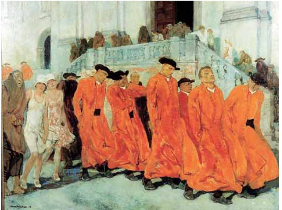
Leuchtende Farbe: „Die roten Röcke des Collegium Germanicum“ stammen aus dem Jahr 1927.