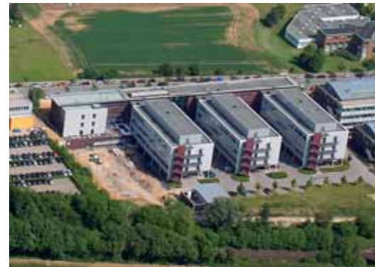
Weiter gewachsen ist das Biomedizinzentrum Dortmund an der Otto-Hahn-Straße im Technologiepark.