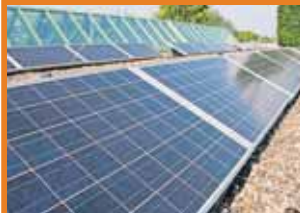
Auf dem TechnologieZentrumDortmund installierte asol solar eine 5,78 kWp-Solarstromanlage.