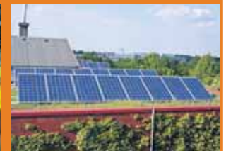
Auf dem begrünten Dach der Dataverde GmbH errichtete asol solar eine 5,85 kWp-Solarstromanlage.