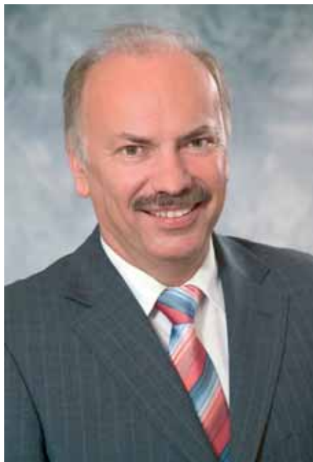
Rolf Bauer, Vorstandsvorsitzender Continentale.

Betracht“, unterstreicht Finanzvorstand Dr. Gerhard Schmitz die Unternehmensphilosophie. Zusätzlich steigerte die Continentale zusammen mit der Europa Krankenversicherung AG bei den Krankenversicherungen ihre Beitragseinnahmen um 3,4 Prozent auf 1,29 Mrd. Euro. Die Zahl der Vollversicherten erhöhte sich um 11.000 auf 375.000. Gleichzeitig erhöhten sich die Leistungen für die Krankenversicherten um 1,6 Prozent auf 1,2 Mrd. Euro. Mit einem Zuwachs von 2,7 Prozent bei den Lebensversicherungen wurde auch hier das Branchenwachstum von 1,1 Prozent deutlich übertroffen.