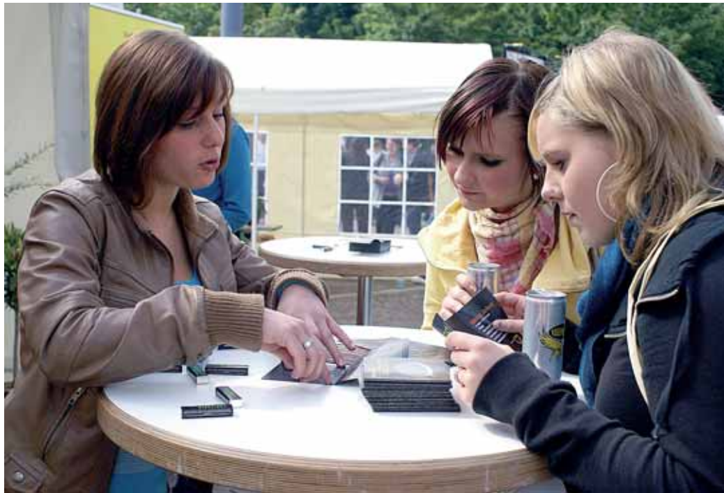
Aus erster Hand erfahren die Schülerinnen und Schüler von den Auszubildenden, wie der Berufsalltag in den verschiedenen Berufen aussieht.

Die Wirtschaftsjuvenen bei der IHK zu Dortmund e.V. sind Teil der Wirtschaftsjuvenen Deutschland (WJD), die mit 11.000 Unternehmern und Führungskräften im Alter bis zu 40 Jahren der Spitzenverband der jungen deutschen Wirtschaft sind. Die WJ erreichen mit ihren Projekten zum Thema Ausbildung jährlich rund 200.000 Schüler. www.wj-dortmund.de