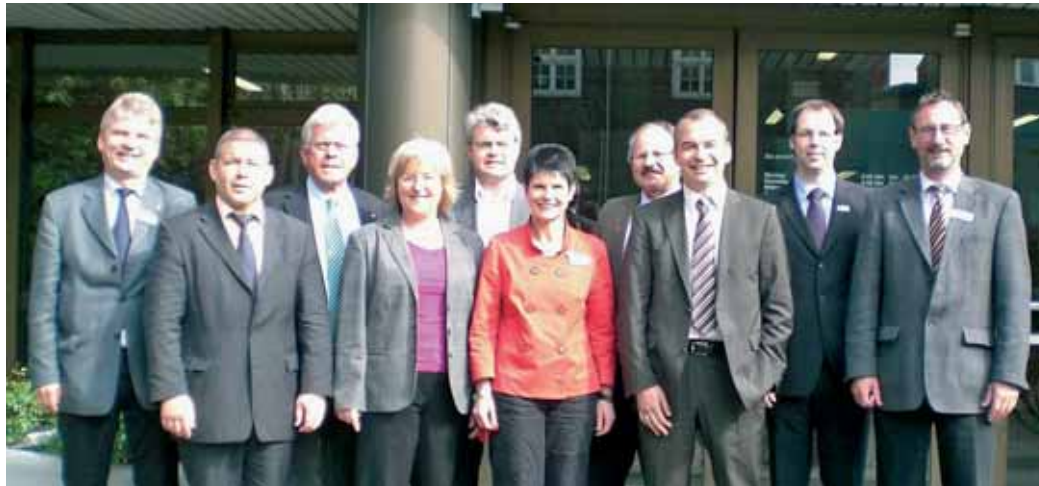
Mitglieder der Initiative „Krise als Chancenutzen“

Informationen sind auf der Internetseite www.ruhrost.info erhältlich.