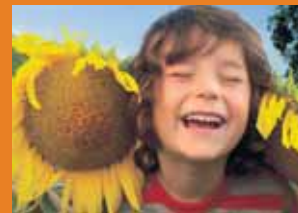
asol solar – Ihr Partner in die solare Zukunft!