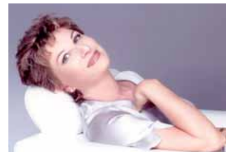
Das Publikum darf sich am 10. Juni auf eine wahre Königin des Belcanto freuen: Mariella Devia.