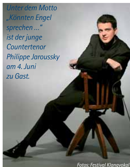
Unter dem Motto „Könnten Engel sprechen ...“ ist der junge Countertenor Philippe Jaroussky am 4. Juni zu Gast.

Schon eine kleine Auswahl von Höhepunkten des Festivals, zeigt die Vielfalt und die hohe Qualität des Programms: Einen Weltstar des Jazz präsentiert Klangvokal am 29. Mai im Konzerthaus: Die amerikanische Jazzikone und mehrfache Grammy-Preisträgerin Dianne Reeves lässt dann mit ihrer faszinierend samtigen Stimme die Tradition des klassischen Jazzgesangs aufleben. Die Kunst der Countertenöre erfährt aktuell auch beim breiten Publikum zunehmend Beachtung. Klangvokal präsentiert mit Andreas Scholl (1. Juni) und Philippe Jaroussky (4. Juni) gleich zwei herausragende Countertenöre unserer Zeit. Über 150 Chöre aus Dortmund werden am 6. Juni das große Chorfest gestalten: Auf zehn Open-Air-Bühnen und in den vier Stadtkirchen zwischen St. Reinoldi und Propsteikirche werden sie die Stadt musikalisch vibrieren lassen.