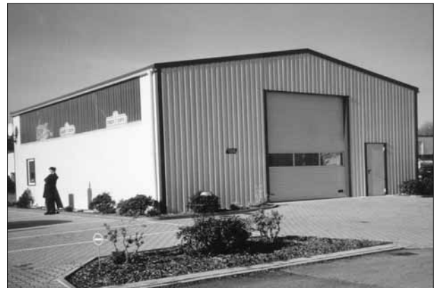
Halle wie abgebildet: Breite 12,50 m x Länge 20,00 m x 4,50 m Traufe

ab Werk: € 30.890 zzgl. 19% MwSt. zuzüglich Montage, Anfahrt- und Transportkosten