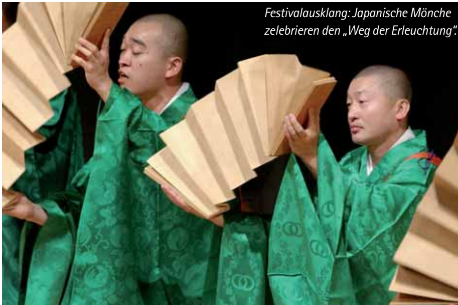
Festivalausklang: Japanische Mönche zelebrieren den „Weg der Erleuchtung“.