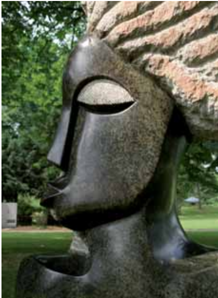
„Proud Lady“, Skulptur von Merchers Chiwawa. Chiwawa lebt und arbeitet seit 1989 als Steinbildhauer in Tengenenge und Harare.