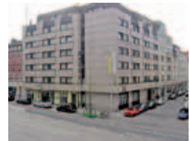
in Dortmund: Ringhotel Drees & Hotel Consul Telefon (02 31) 1 29 90

Empfehlenswerte 4****-Häuser für Ihre Gäste, Mitarbeiter und Geschäftspartner in und um Dortmund