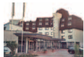
in Herdecke: Ringhotel Zweibrücker Hof Telefon (0 23 30) 60 50