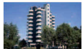
in Witten: Ringhotel Parkhotel Witten Telefon (0 23 02) 58 80

Fordern Sie uns als kompetenter Partner für Ihre Tagungen von 10 bis 350 Personen!