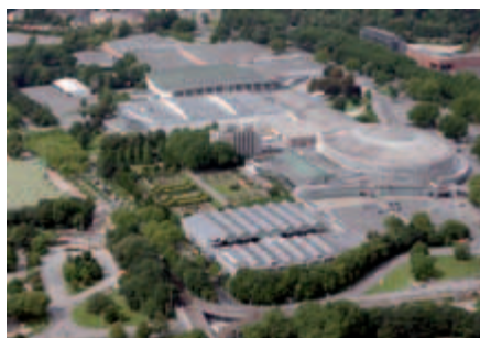
Die KHC Westfalenhallen GmbH bewirtschaftet natürlich auch die kompletten Westfalenhallen.

Die Gesellschaft stellt die gastronomische Versorgung bei Messen, Kongressen und Großveranstaltungen sicher. Sie be-