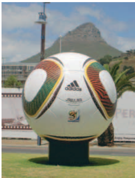
So sieht der offizielle Ball für die Fußball-WM 2010, der Jabulani, aus. In Kapstadt an der Waterfront stehen die Bälle in Übergröße.

ratoren angewiesen. Auf der Suche nach einer Lösung hat das westafrikanische Land mit Deutschland eine Energiepartnerschaft geschlossen: Deutschland unterstützt mit Know-how bei rund einem Dutzend Kraftwerksprojekten, im Gegenzug könnte Gas nach Europa geliefert werden. Südafrika will seine Kapazitäten bis 2018 um 16.000 MW erweitern und langfristige Verträge auch mit privaten Betreibern abschließen. Der Korrespondent von Germany Trade & Invest, Carsten Ehlers, sieht gute Chancen: „Öffentliche Projekte im Häuserbau sowie neue Gesetze zur Gebäudeeffizienz schaffen neuen Bedarf. Eine wichtige Rolle kommt den erneuerbaren Energien zu. Die dezentrale Solartechnik bietet sich vor allem für ländliche Regionen an“. Windparks entstehen in Südafrika am Western Cape und Eastern Cape.